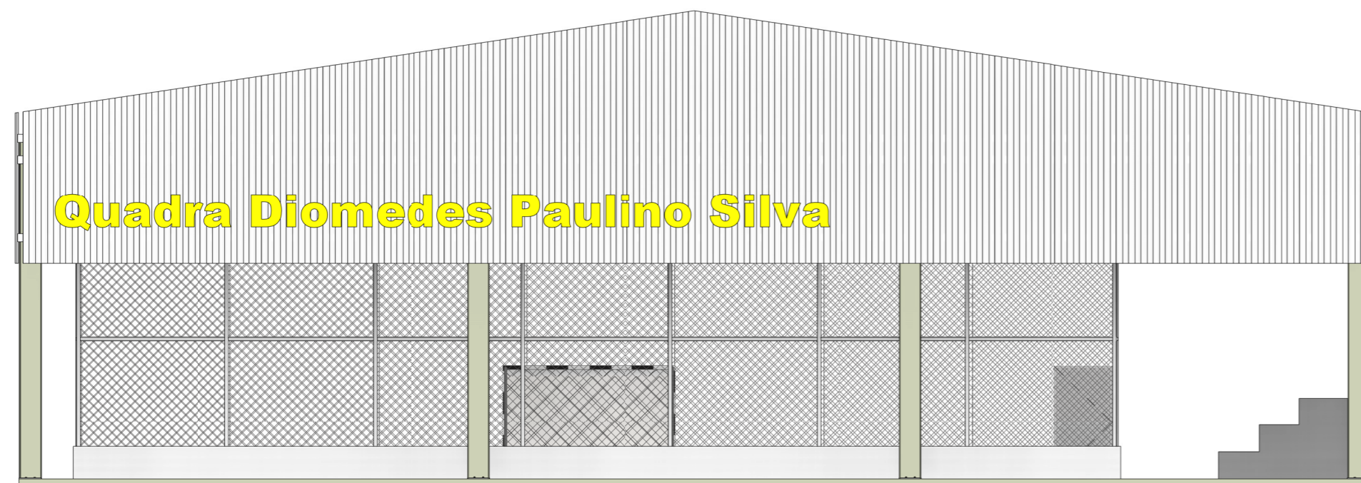
2 FACHADA FRONTAL ESCALA - 1 : 100