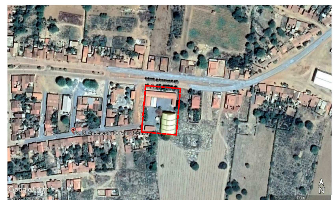
PLANTA GEORREFERENCIADA SEM ESCALA ----- ESCOLA DURVAL S. BAGANO