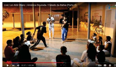
Live: Lei Aldir Blanc | América Dourada / Estado da Bahia (Parte 2)