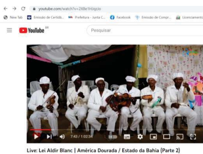
Live: Lei Aldir Blanc | América Dourada / Estado da Bahia (Parte 2)