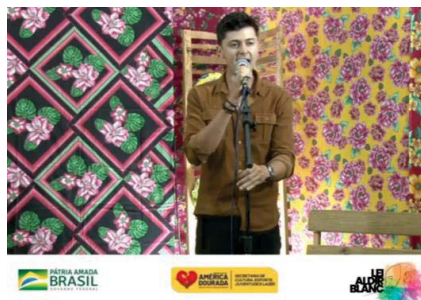
GABRIEL DINIZ FREITAS (Cantor)