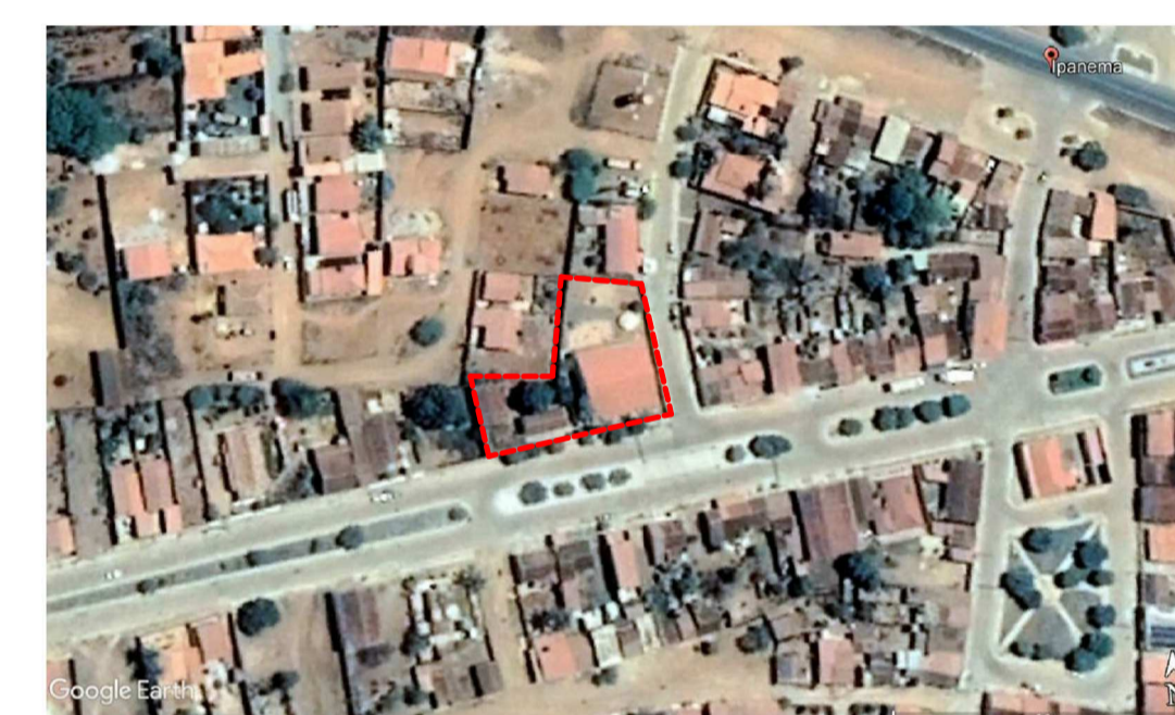
PLANTA GEORREFERENCIADA SEM ESCALA - - - - ESCOLA VALDENI B. SANTOS