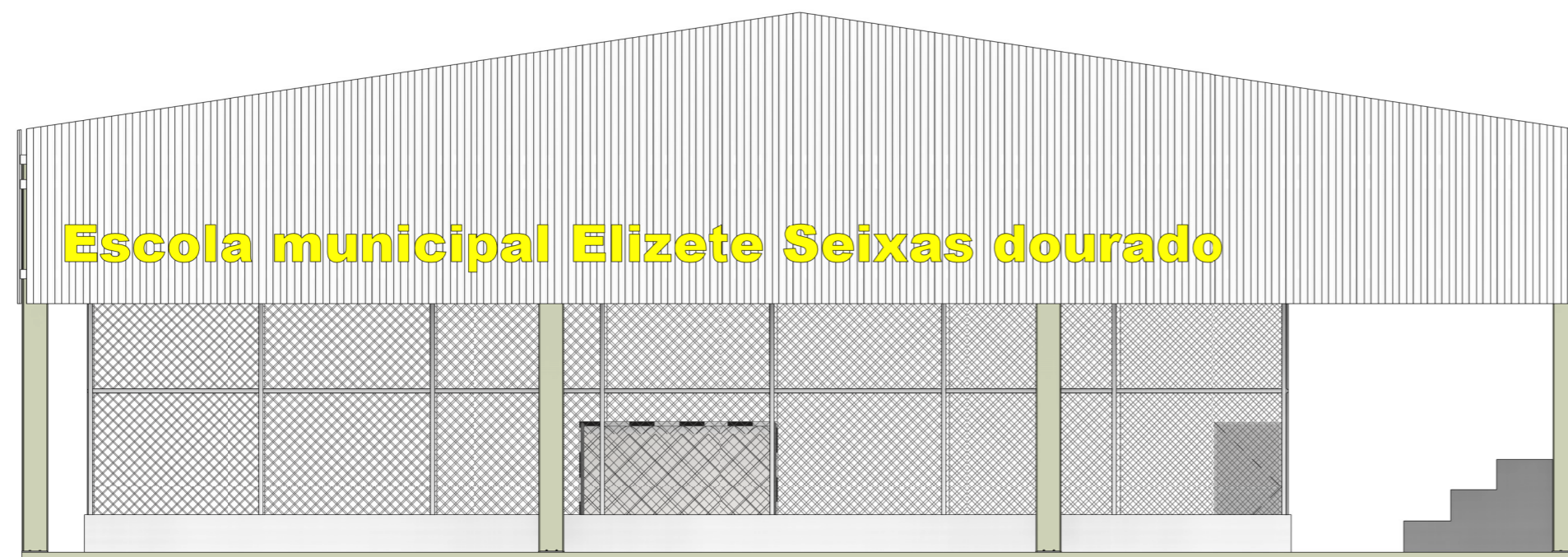
2 FACHADA FRONTAL ESCALA - 1 : 100