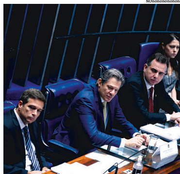
Campos Neto, Haddad e Pacheco no Senado Federal