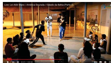
Live: Lei Aldir Blanc | América Dourada / Estado da Bahia (Parte 2)