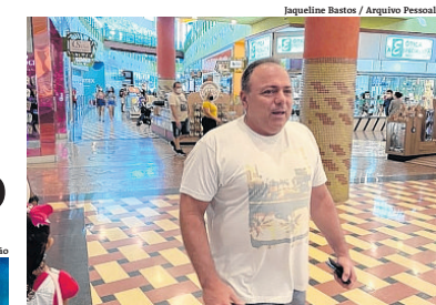
Ex-ministro recebeu uma máscara de presente