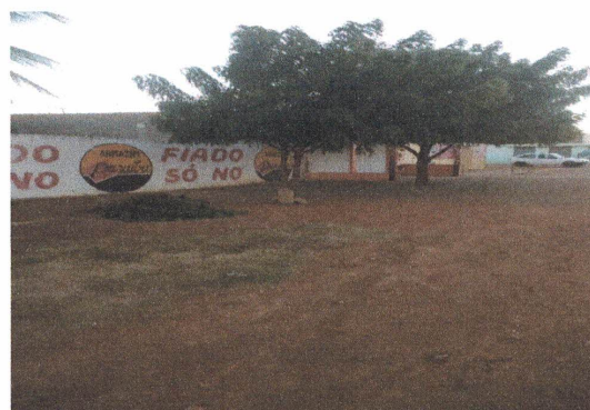
espaço onde será construída a garagem