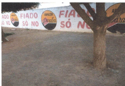
Espaço aproximado entre o muro e árvore 3 metros