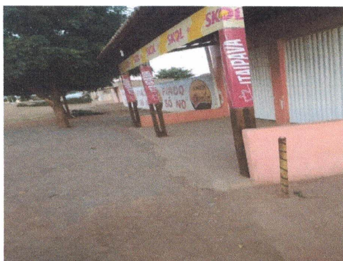
Azadirachta índia, margosa- Nim

ESTADO DA BAHIA MUNICÍPIO DE AMÉRICA DOURADA Av. Romão Gramacho, 77 – Centro – Cep. 44.910-000 Tel.: (74) 3692-2000 – CNPJ. 13.891.536/0001-96