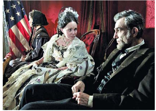
Sally Field e Daniel Day-Lewis no drama Lincoln: ambos indicados