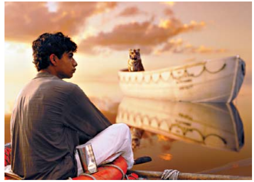
As Aventuras de Pi, de Ang Lee, recebeu 11 indicações ao Oscar 2013