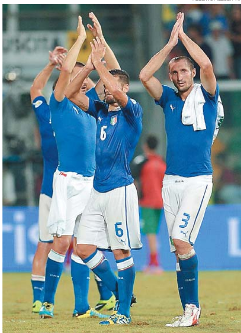
Italianos comemoram: basta uma vitória hoje para garantir lugar na Copa

Na América do Norte e Central, a Costa Rica precisa apenas empatar com a Jamaica para comemorar. Já os EUA precisam superar o México, em casa.