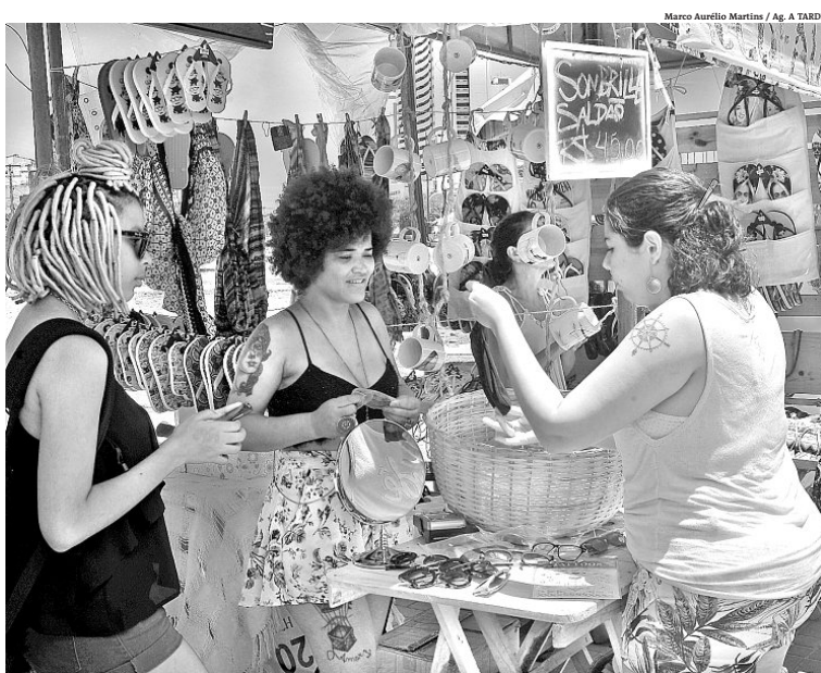
Marco Aurélio Martins / Ag. A TARDE