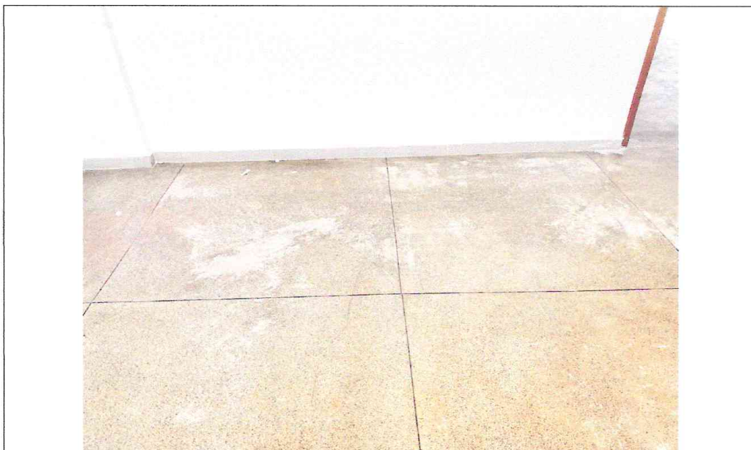
Foto 06: Piso com imperfeições e juntas de dilatação apresentando deslocamento