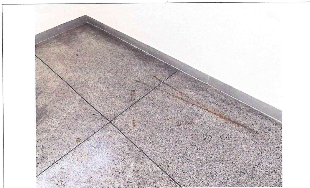
Foto 08: Piso com imperfeições e juntas de dilatação apresentando deslocamento.