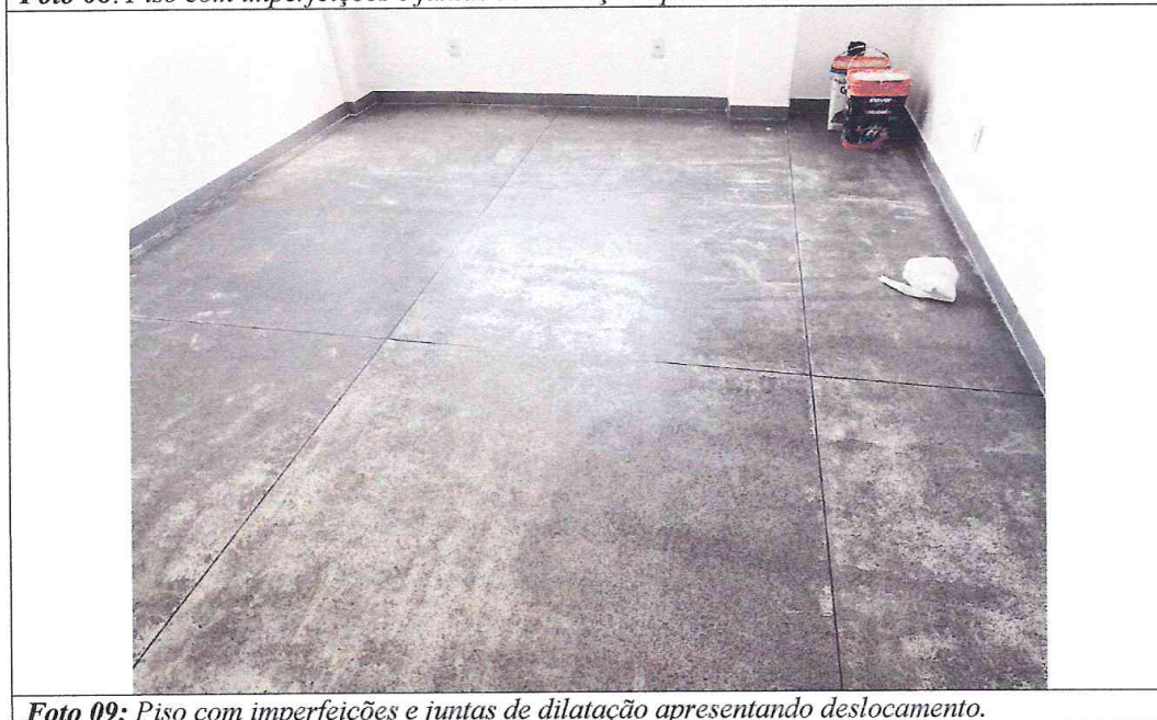
Foto 09: Piso com imperfeições e juntas de dilatação apresentando deslocamento.