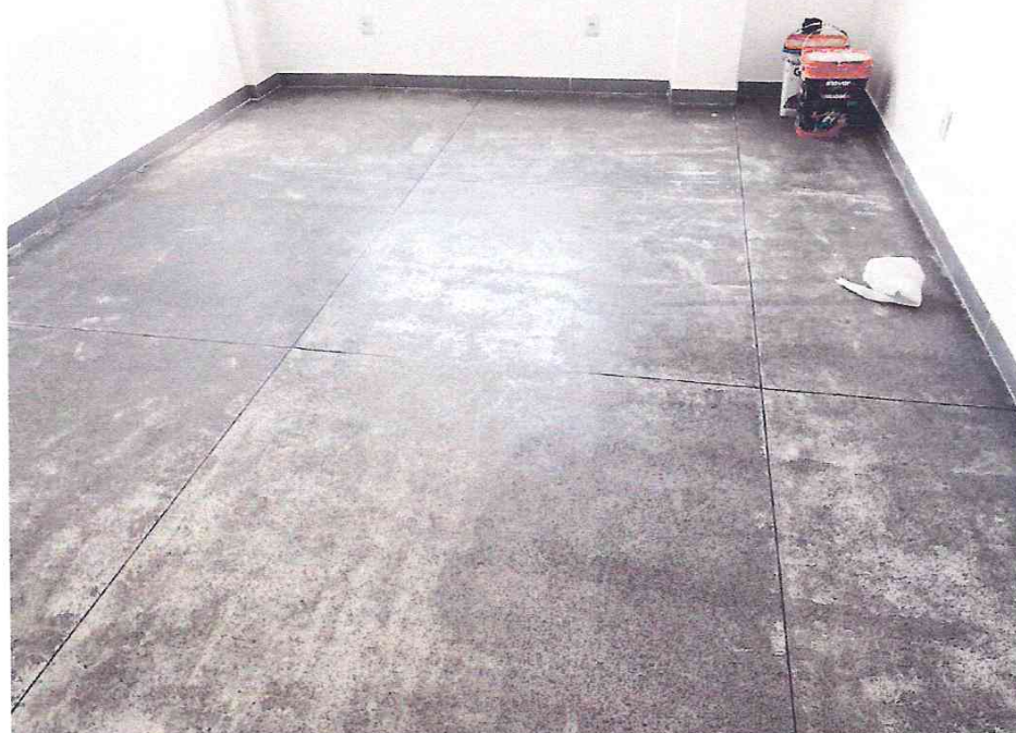
Foto 09: Piso com imperfeições e juntas de dilatação apresentando deslocamento.