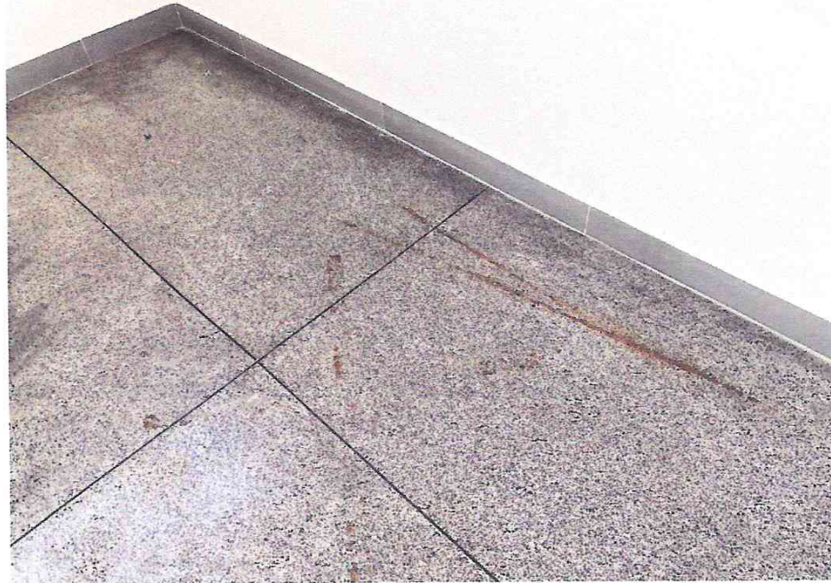
Foto 08: Piso com imperfeições e juntas de dilatação apresentando deslocamento.