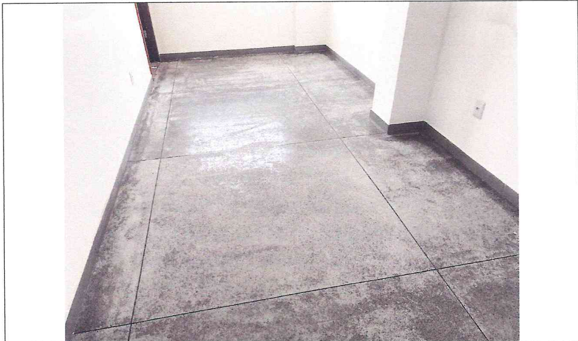
Foto 10: Piso com imperfeições e juntas de dilatação apresentando deslocamento.