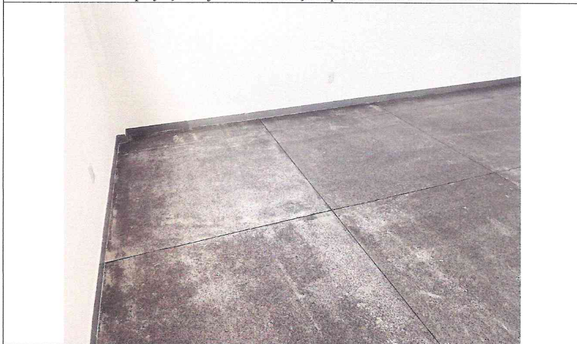
Foto 07: Piso com imperfeições e juntas de dilatação apresentando deslocamento