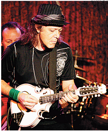
Armandinho fará homenagem a Dorival Caymmi