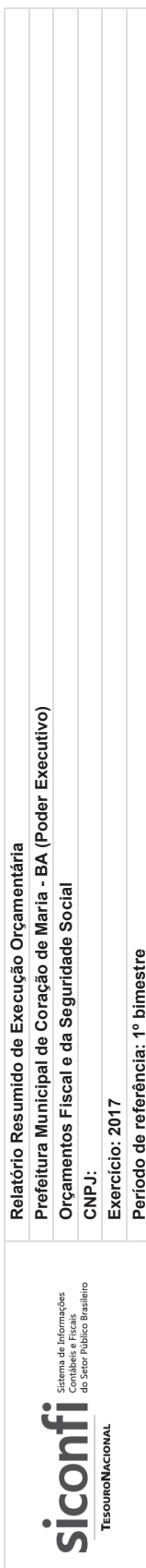
RREO-Anexo 06 | Tabela 6.0 - Demonstrativo do Resultado Primário - Municípios