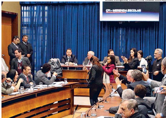
Os três delegados iniciaram as investigações sobre a máfia que envolve governo