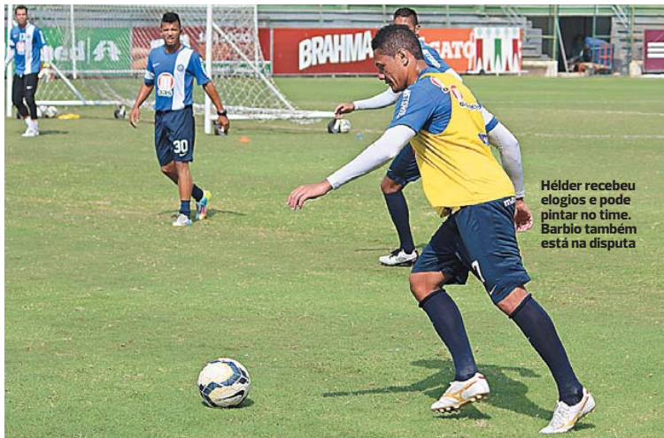
Helder recebeu elogios e pode pintar no time. Barbio também está na disputa