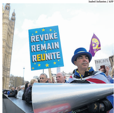
O Parlamento de Westminster é palco de protestos

O deputado conservador Jacob Rees-Mogg, líder do principal grupo eurocético, lamentou que o futuro do Brexit tenha sido deixado para Corbyn, "um notório marxista". É dois secretários de Estado se demitiram ontem. Chris Heaton-Harris, encarregado dos preparativos para uma saída sem acordo no ministério do Brexit, afirmou não poder "simplesmente apoiar uma nova extensão".